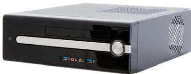
Mini ITX Flyer